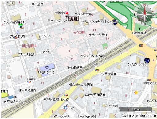
居住誘導区域内・都市機能誘導区域外