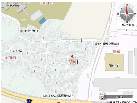
高さ制限10m、外壁後退1m、建築基準法第22条区域

現況と異なる場合には現況を優先します。 該当物件が建築条件付き宅地だった場合、土地売買契約締結後3カ月以内に売主と住宅の建築請負契約を締結していただくことを条件として販売いたします。 この期間内に住宅を建築しないことが確定したとき、または住宅の建築請負契約が成立しなかった場合は、土地売買契約は無効となり、 受領した金額は全額無利息でお返しします。